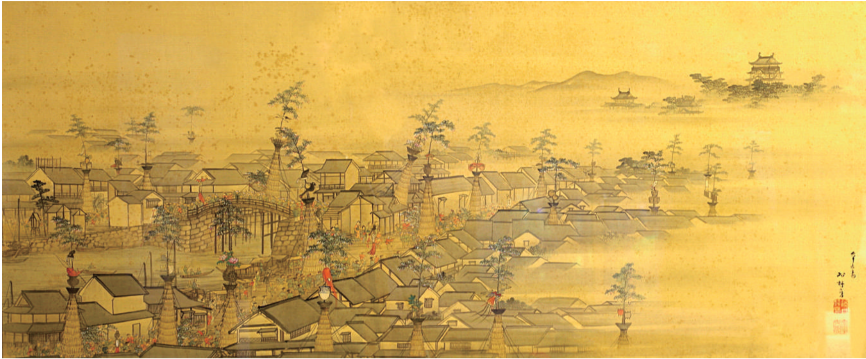
この絵は、江戸時代末期、福山藩お抱え絵師、藤井松林の描いたわたしたちの街の姿です。向こうに福山城を見、お堀からのびた入り江に懸った木綿橋、天下橋を中心として、東堀端（現伏見町）からとおり町筋（現本通）、神島町筋（現船町）に繰り広げられた城下30ヶ町の勇壮な左義長が見事に描かれています。

約400年前に大きな入り江に架けられた木綿橋、天下橋に接する4つの商店街（略称：よんまち）が商店街、地域住民のかわら版として発行します。（Brige Town Plan）地域交流の懸け橋、過去と未来の懸け橋として