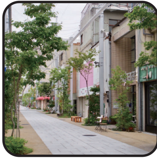
とおり町・本通り