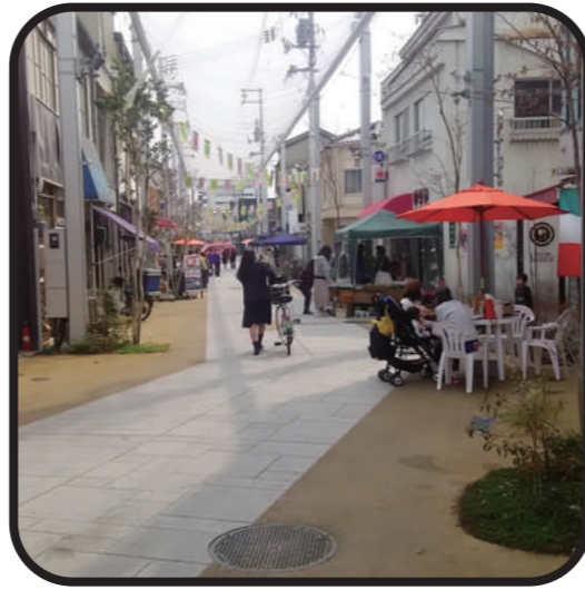
とおり町・本通船町