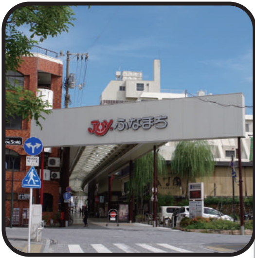
Joy ふなまち・宝船会